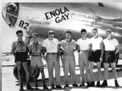
L'équipage de l' Enola Gay le 6 août 1945.

Juin 1946 Le gouvernement américain commence une série d'essais nucléaires sur les atolls de Bikini et d'Enewetak dans les îles Marshall, un territoire stratégique sous mandat des Nations Unies administré par les États-Unis. Le programme d'essais compte 67 essais nucléaires atmosphérique entre 1946 et 1958.