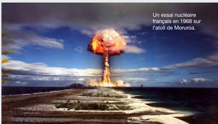
Un essai nucléaire français en 1968 sur l'atoll de Moruroa.

« Ils étaient tous habillés dans des tenues spéciales avec des gants et un masque. Nous, les travailleurs maohi, suivions derrière eux, sans aucun équipement spécial pour nous protéger », raconte-t-il. « Les chefs disaient "c'est ok, vous pouvez aller là-bas". Nous avions peur, mais si nous avions refusé, on nous aurait mis dans le prochain avion pour Tahiti.