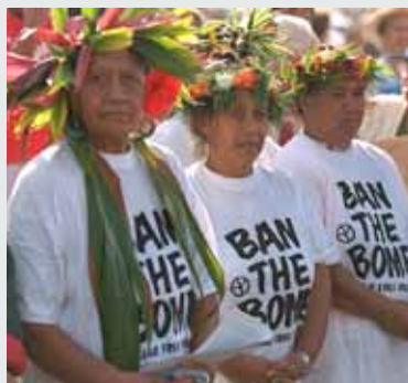
Manifestation antinucléaire à Rarotonga, îles Cook, en 1995.

Nouvelle-Zélande ont fait pression pour que la zone ne soit pas une contrainte pour les déploiements militaires de leur allié de l'ANZUS, les États-Unis. La contribution du gouvernement australien, en avril 1985, notait que « la proposition vise à maintenir les avantages de sécurité offerts au sud-ouest du Pacifique par le traité ANZUS et la présence de sécurité des États-Unis dans la région ».