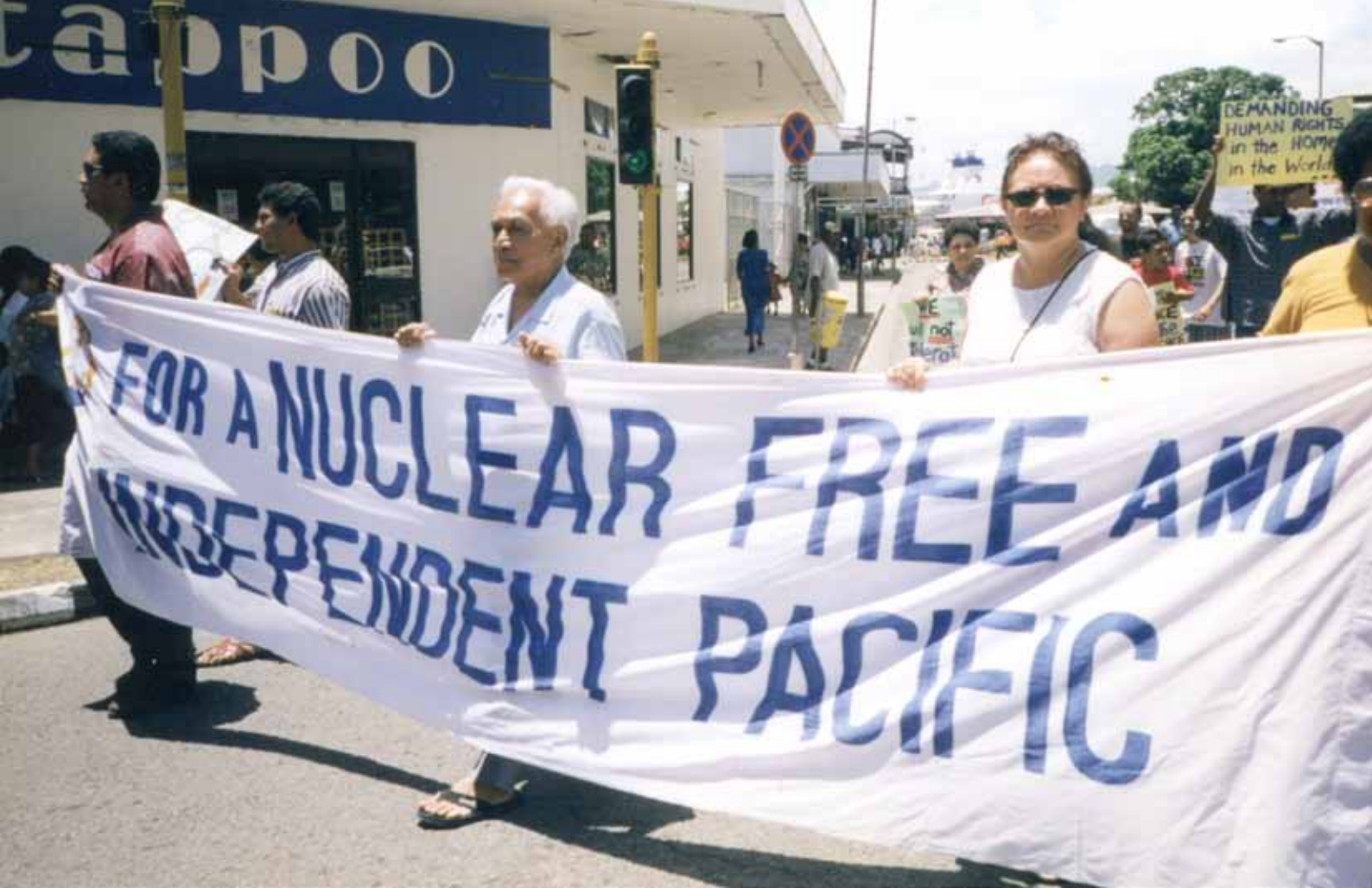
Ci-dessus : Manifestants pour un Pacifique indépendant et sans nucléaire à Fidji (1996). À droite : Tee-shirt dénonçant les armes et déchets nucléaires dans le Pacifique. Ci-dessous : Inauguration du Mémorial des essais nucléaires à Tahiti (2006).