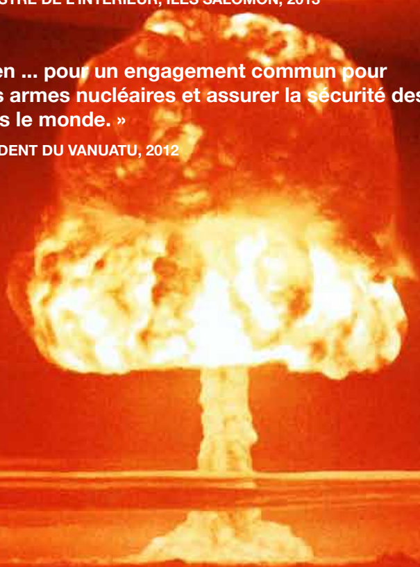
Le champignon de « Romeo », bombe thermonucléaire de 11 mégatonnes testée par les États-Unis, se lève sur l'atoll de Bikini en mars 1954.

– IOLU JOHNSON ABIL, PRÉSIDENT DU VANUATU, 2012