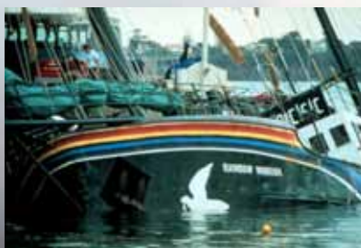
Le Rainbow Warrior , navire protestataire, dynamité par la France en 1985.

Juin 1987 La législation anti-nucléaire de Nouvelle-Zélande interdit les visites dans ses ports de navires porteurs d'armes nucléaires ou à propulsion nucléaire.