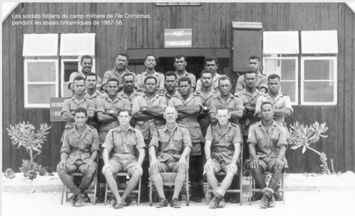
Les soldats fidjiens du camp militaire de l'île Christmas pendant les essais britanniques de 1957-58.