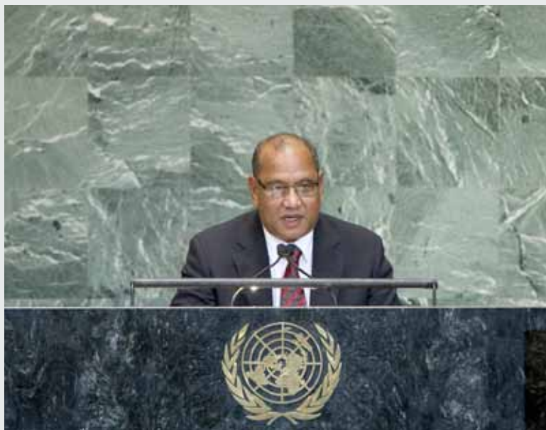
Le Président Loeak à l'Assemblée générale des Nations Unies en 2012.

En d'autres termes, alors que le nombre d'essais effectués aux îles Marshall ne représente qu'environ 14 % de tous les essais américains, la puissance totale des essais des Marshall a représenté près de 80 % du total des essais atmosphériques