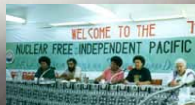
La 7 ème conférence pour un Pacifique indépendant et sans nucléaire, à Suva, Fidji 1996.

24 septembre 1996 Le traité d'interdiction complète des essais nucléaires est ouvert à la signature aux Nations Unies. La Chine, la France, le Royaume-Uni, la Russie et les États-Unis signent tous le traité, l'Inde dit qu'elle ne le signera pas.